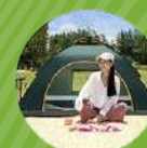
TIENDA DE CAMPAÑA