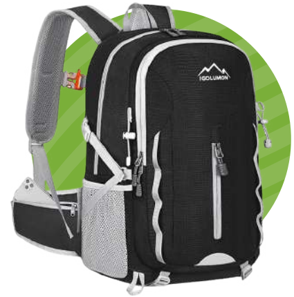
MOCHILA DE CAMPING