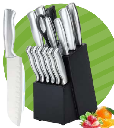
SET DE CUCHILLOS