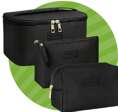
SET DE COSMETIQUERAS