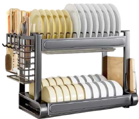
ESCURRIDOR DE TRASTES