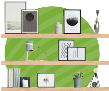
SET DE REPISAS