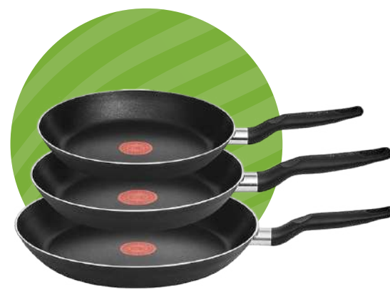
SET DE SARTENES