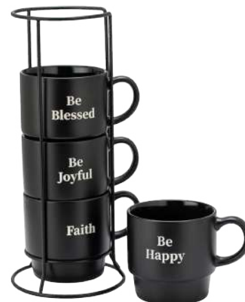
JUEGO DE TAZAS