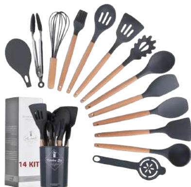
SET DE UTENSILIOS