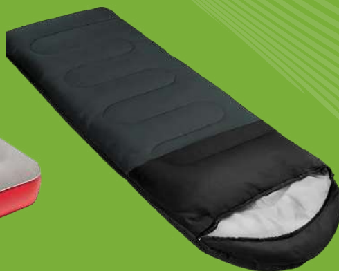
SACO PARA DORMIR