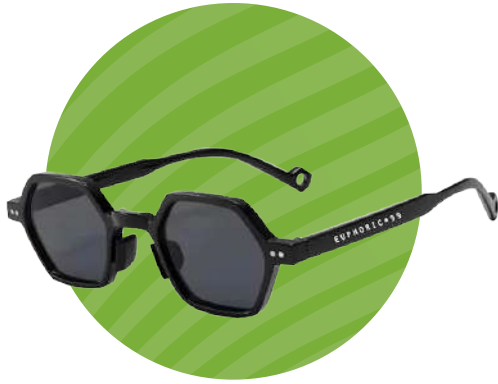
LENTE DE SOL UNISEX