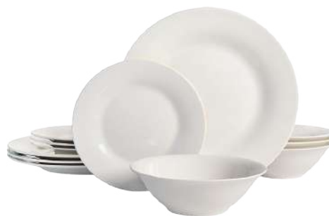
JUEGO DE VAJILLA