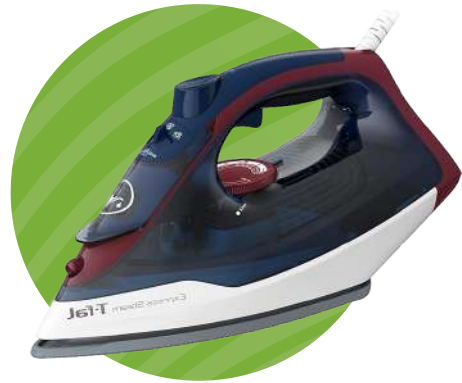
PLANCHA DE VAPOR PARA ROPA