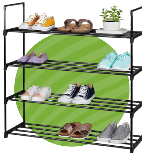
ORGANIZADOR DE ZAPATOS